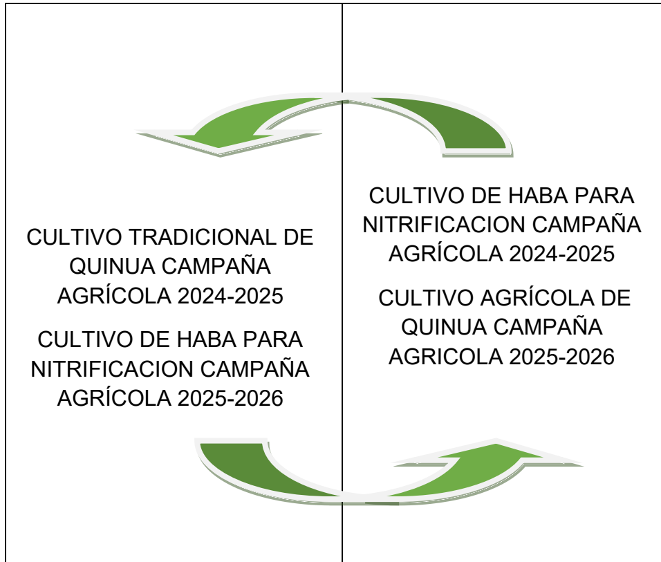
Fig.4. Parcela modelo con tratamientos